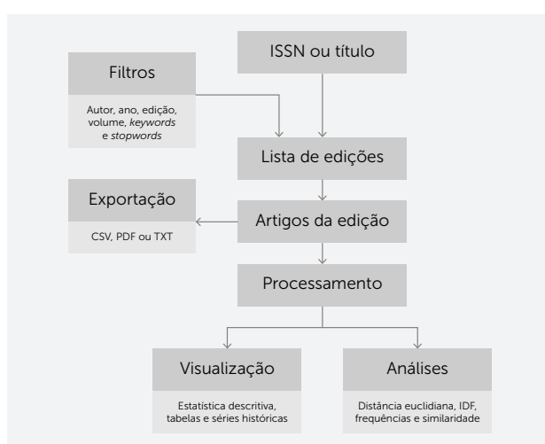
Figura 3 · Modelo conceitual da aplicação